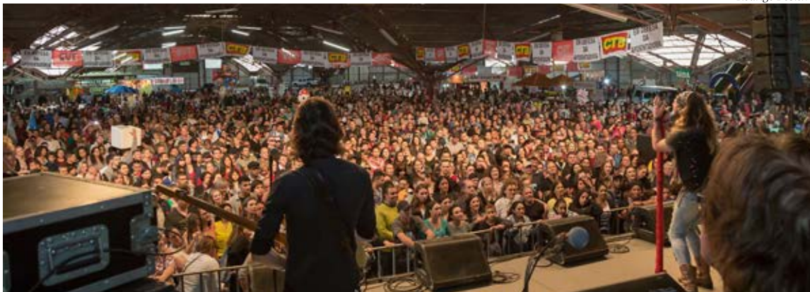
Entre um show e outro, líderes sindicais dialogaram com o público sobre a importância de unir forças contra a retirada de direitos

Mais de dez mil trabalhadores prestigiaram o Ato Show Dia do Trabalhador, em defesa da aposentadoria e contra a Reforma da Previdência, promovido pelo Sindicato-mercariários Caxias,