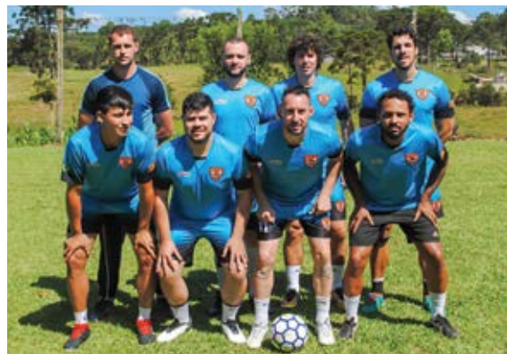
Terceiro lugar: Vivara