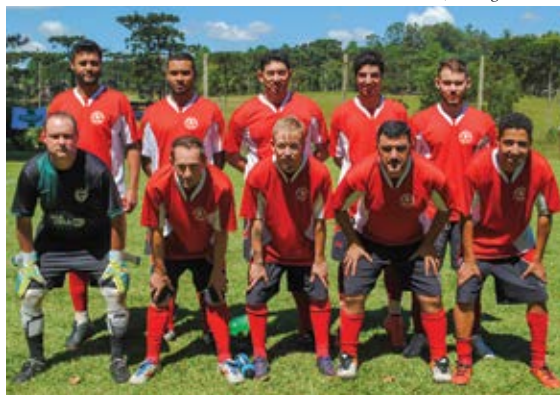
Segundo lugar: Dinamo Caxiense