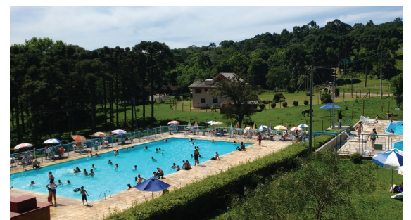
Sindicomercários conta com uma estrutura completa de atendimento médico, odontológico, psicológico e jurídico, além de lazer na Sede Campestre, conquistada e mantida pela participação dos associados

O Sindicomercários Caxias presta inúmeros atendimentos para associados e seus dependentes. Somente no ano de 2017, foram 10.233 atendimentos médicos, 17.371 odontológicos, 2.045 psicológicos, além dos jurídicos. O Sindicomercários também tem a Sede Campestre com uma infraestrutura de esporte e lazer de qualidade para as famílias.